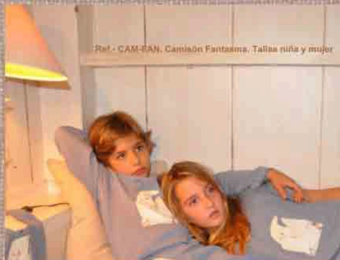
Ref. - CAM-FAN, Camisón Fantasma, Tallas niña y mujer