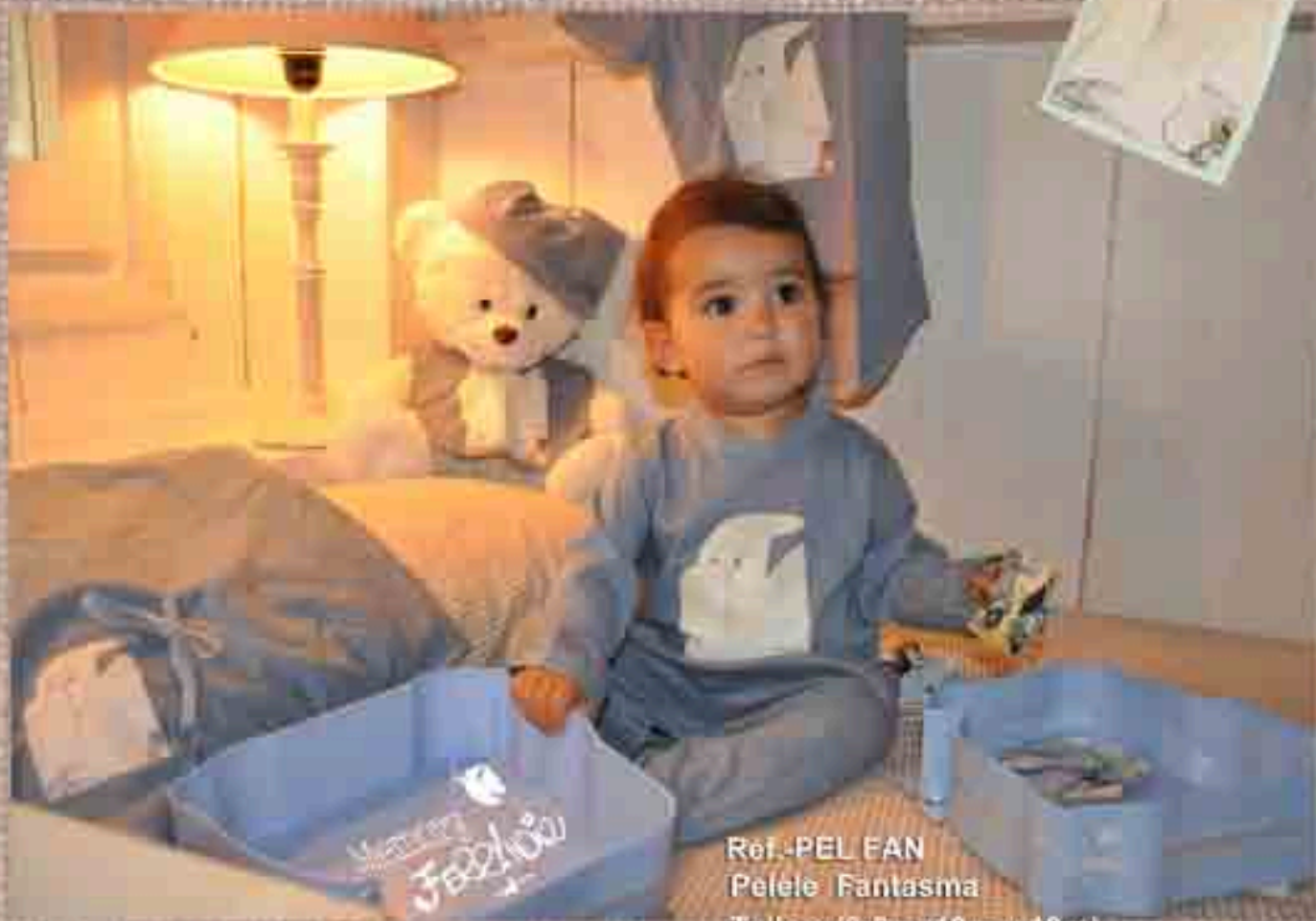
Ref.:PEL FAN Pelele Fantasma Tallas (0-6m, 12m y 18m)