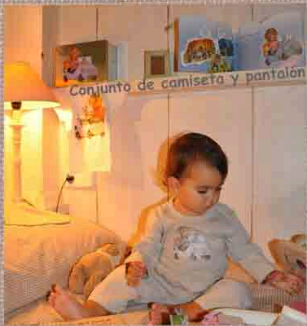
Ref. CAMPAN-BC Camiseta y pantalón biscuter Tallas (12m y 18m)