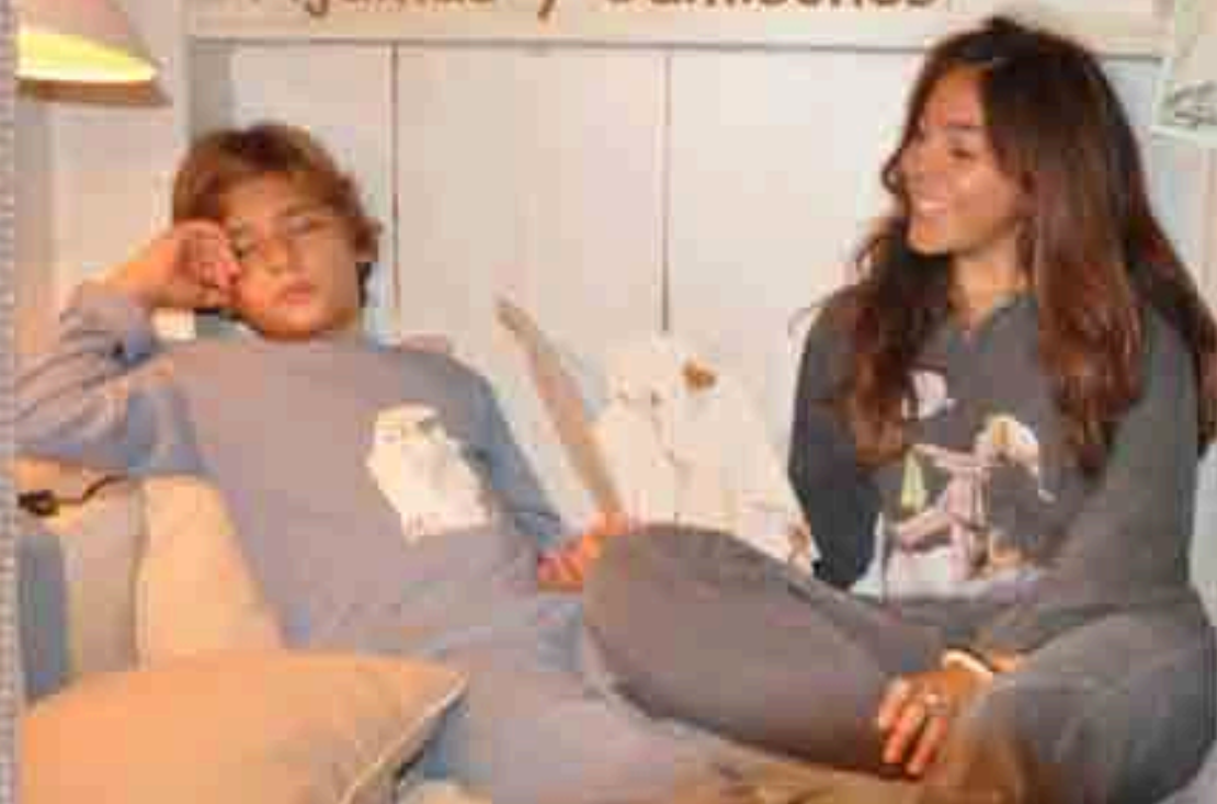
Ref. - PIJ-FAN Pijama Fantasma Tallas niño(a) 2-4, 6-8 y 10-12